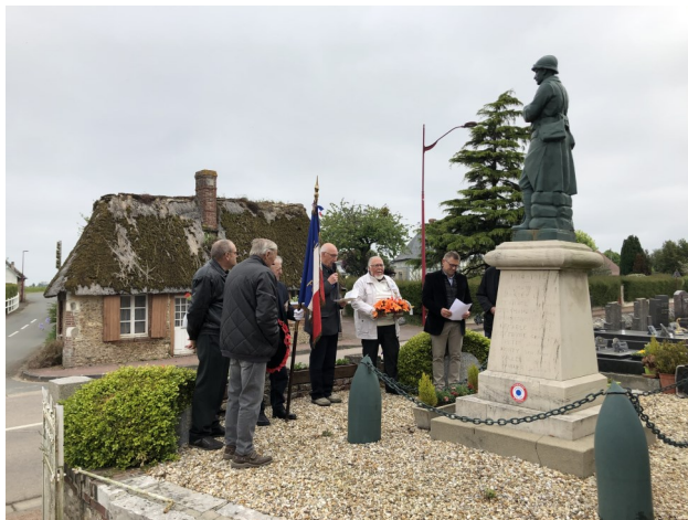
Monument aux morts de Fourmetot