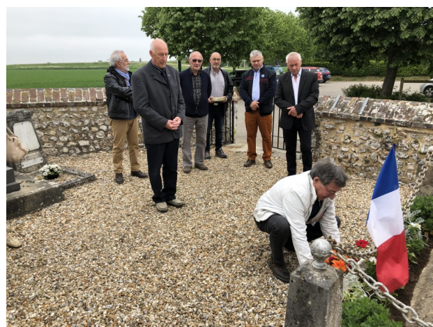
Monument aux morts de Saint Ouen des Champs