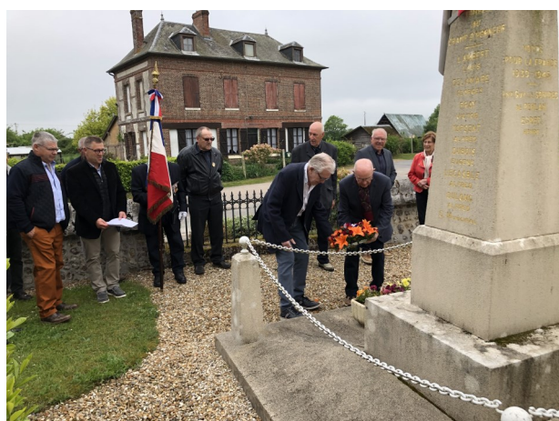
Monument aux morts de Saint Thurien